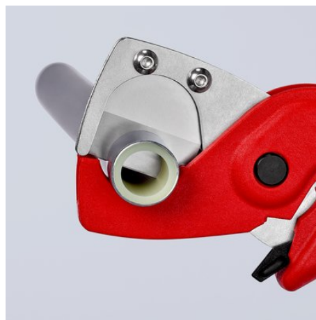
Das hochfeste, scharfe Messer schneidet Verbund- und Kunststoffrohre glatt und gratfrei