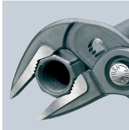
Greift Muttern bis 34 mm Schlüsselweite