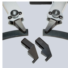
wechselbare Einsätze für Innen und Außenringe