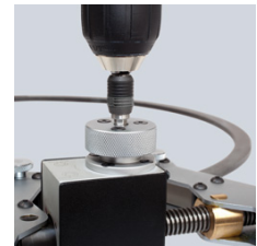
maschinell zu betätigen

Technische Änderungen und Irrtümer vorbehalten