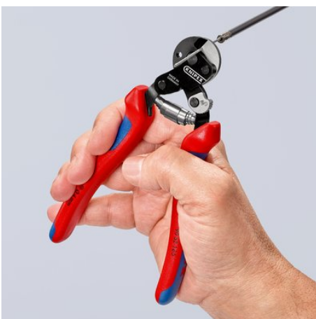
Mit 160 mm Länge kompakt und trotzdem leistungsstärker als viele größere Drahtseilscheren

Technische Änderungen und Irrtümer vorbehalten