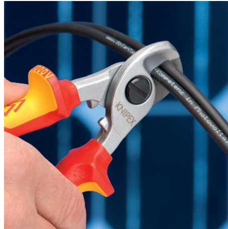
95 26 165: Sperrklinke verriegelt Scheren mit innenliegender Öffnungsfeder