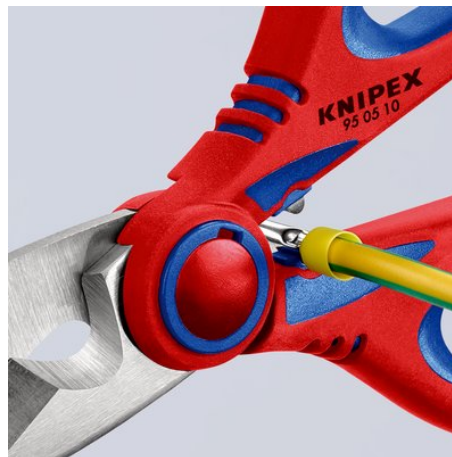
95 05 10 SB: Schnelles, einfaches Crimpen