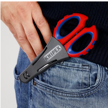
Sicher verstaut und immer griffbereit

Technische Änderungen und Irrtümer vorbehalten