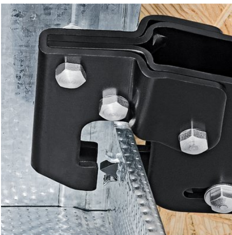
Das Stempelwerkzeug wird durch die Profilbleche gedrückt

Technische Änderungen und Irrtümer vorbehalten