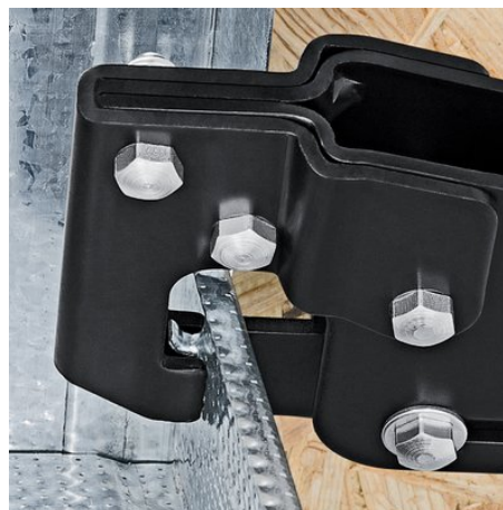
Ansetzen der Zange an zwei zu verbindenden Profilblechen