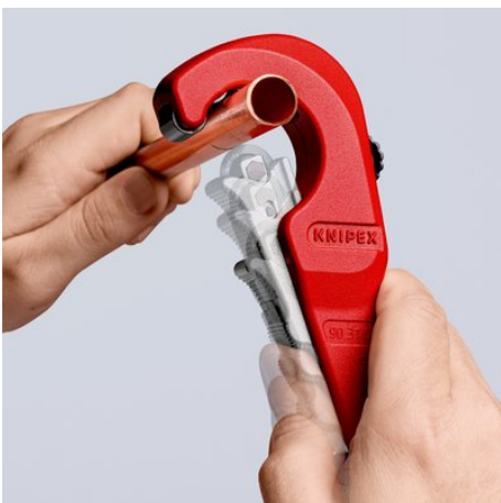
Die neue Leichtigkeit des Schneidens: geöffneten KNIPEX TubiX® Rohrabschneider ansetzen ...