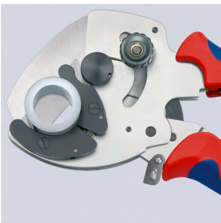
Sauberes Schneiden dickwandiger Kunststoff- und Verbundrohre

Technische Änderungen und Irrtümer vorbehalten