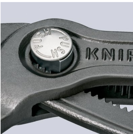
Feinverstellung per Druckknopf: schnell und komfortabel

Technische Änderungen und Irrtümer vorbehalten