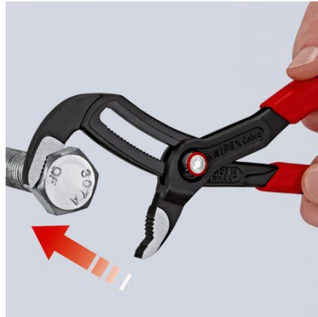
Maul anlegen - Zange einfach zuschieben