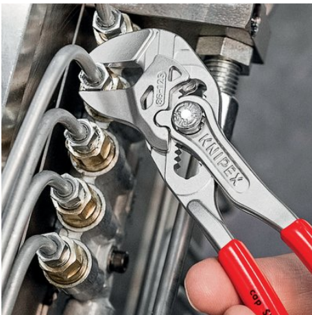
der Mini-Zangenschlüssel für feinmechanische Arbeiten