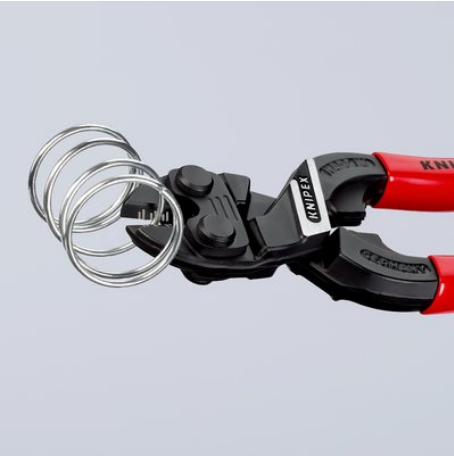
Leistungsstark bis in die Spitzen