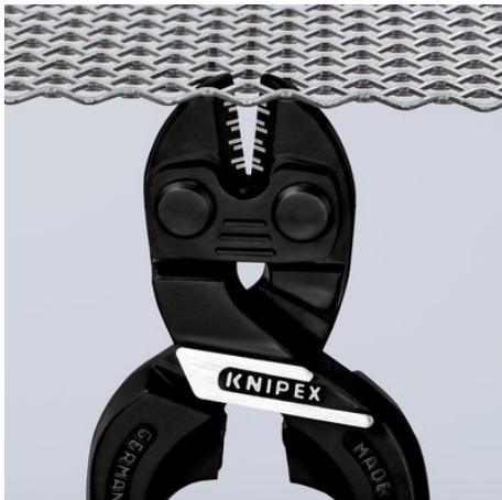
Schlanker Kopf für optimale Zugänglichkeit