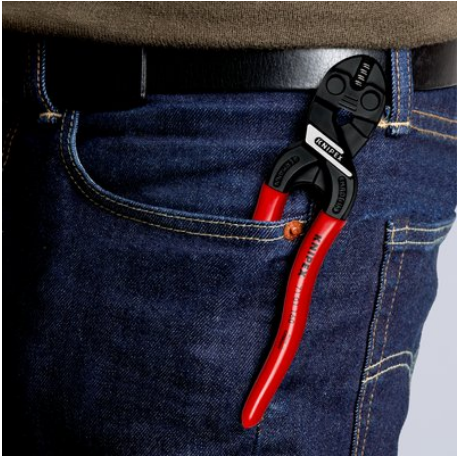
Kompakt, leicht und immer dabei

Technische Änderungen und Irrtümer vorbehalten