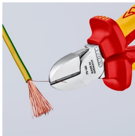
Sauberer Schnitt bei dünnen Cu-Drähten, auch an den Schneidenspitzen