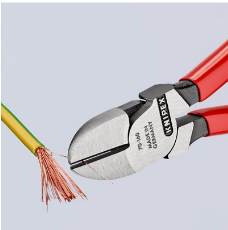
Sauberer Schnitt bei dünnen Cu-Drähten, auch an den Schneidenspitzen