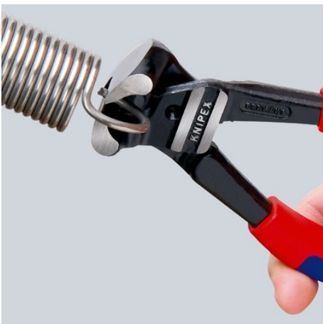
Hohe Schneidleistung: auch für Pianodraht

Technische Änderungen und Irrtümer vorbehalten