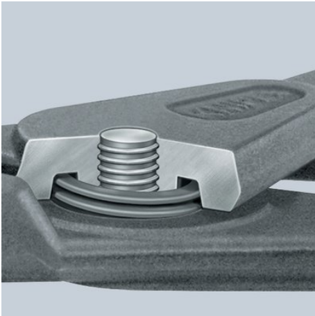
Innenliegende Feder: geschützte Lage im geschraubten Präzisionsgelenk. Keine Behinderung bei der Arbeit, keine Verschmutzung oder Verlust