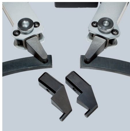
wechselbare Einsätze für Innen und Außenringe