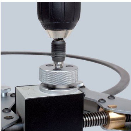
Maschinell oder von Hand zu betätigen

Technische Änderungen und Irrtümer vorbehalten