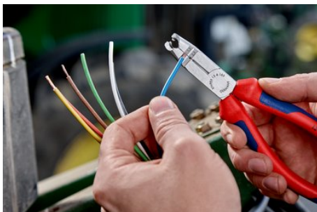
Abisolierlöcher für Leiter 1,5 und 2,5 mm 2

Technische Änderungen und Irrtümer vorbehalten