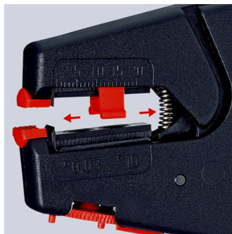
12 40 200: Einstellbarer Längenanschlag