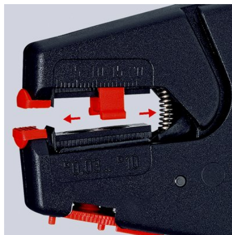
12 40 200: Einstellbarer Längenanschlag