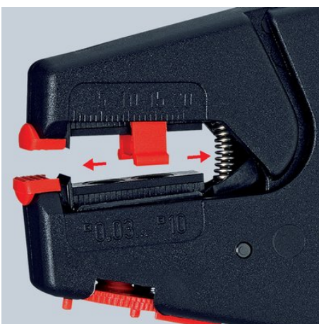
12 40 200: Einstellbarer Längenanschlag

Technische Änderungen und Irrtümer vorbehalten