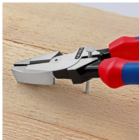
Greifzone unterhalb des Gelenks für kraftvolles Hebeln