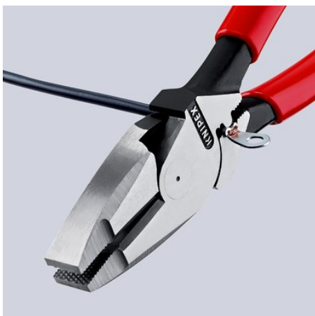
09 11/12 240: Universelle Dorn-Crimpstelle unterhalb des Gelenks

Technische Änderungen und Irrtümer vorbehalten